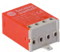
fino a 15 pulsanti

Max 15 illuminated push-buttons, without capacitor