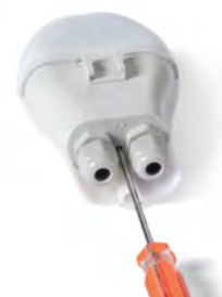
Regolazione esterna External adjustment